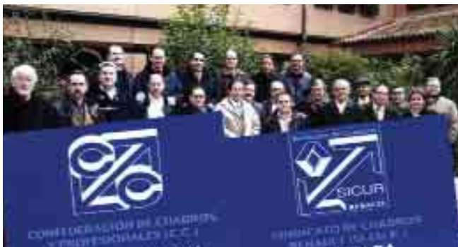
Participantes en la Asamblea de SICUR-PALENCIA