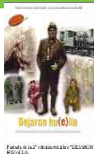
Portada de la 2ª edición del libro "Dejaron huella"

El libro está ilustrado con más de medio millar de fotografías del archivo fotográfico MIR de Marino Iglesias Rodríguez, y además incluye una exhaustiva bibliografía y lexicografía.