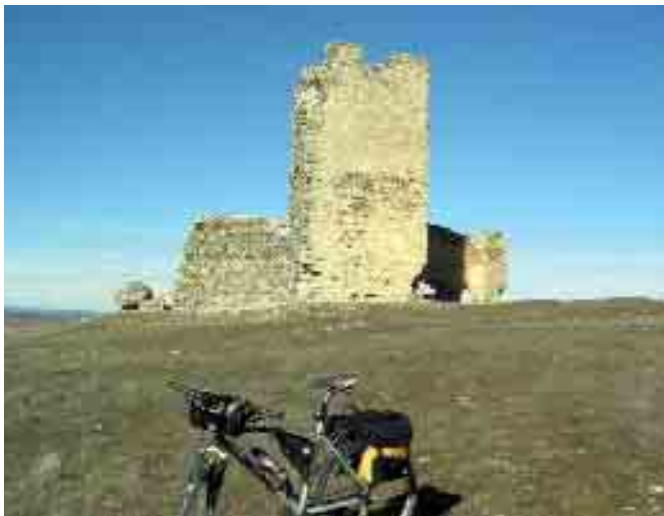
Castillo de La Torresaviñán

Torremocha del Campo , es un pueblo situado al lado de la N11, en la provincia de Guadalajara. La sólida torre de piedra de su iglesia y algunas casas con un evidente empaque atestiguan un pasado próspero. Situado en la tradicional vía de comunicación entre la meseta y Aragón, es un lugar ideal para iniciar y terminar nuestra ruta, ya que cuenta con numerosos locales donde poder coger y reponer fuerzas.