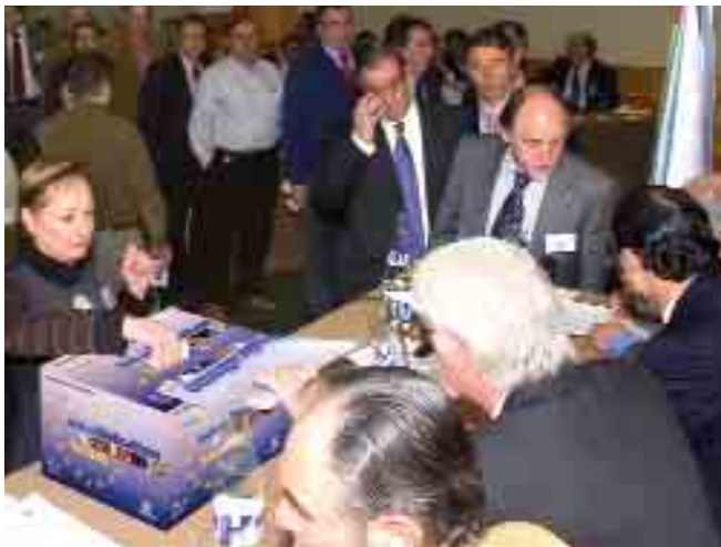
Un momento de la votación en el que los compromisarios guardan turno para depositar su voto