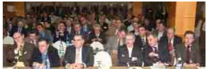
En primera fila los invitados de UGT, CCOO, CEOE, AEB y Ayuntamiento de Madrid