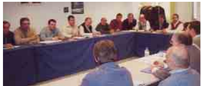
Los miembros de SITAT reunidos durante la celebración de su Asamblea General

La Asamblea General de SITAT, celebrada en el mes de noviembre de 2004, solicitó la impugnación de este Convenio. En la actualidad los representantes de SITAT intentan llegar a acuerdos, que eviten esta medida.