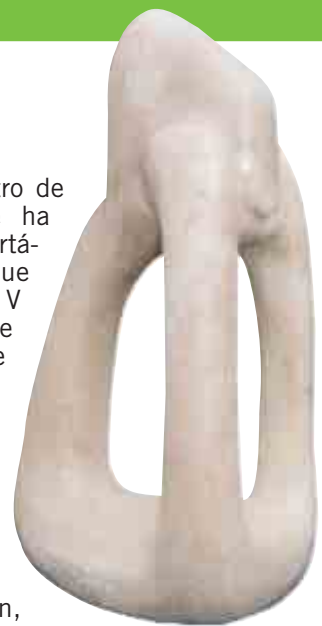
"Hombre de Neanderthal" Obra seleccionada en la XII Exposición de Pequeño Formato en Aranjuez (octubre de 1991). Técnica: Talla directa. Materiales: Mármol de Portugal