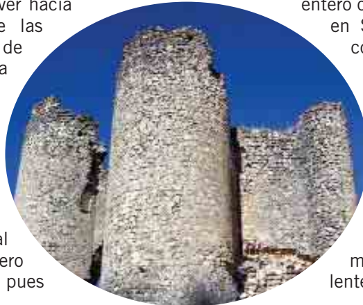
Castillo de Pelegrina

extiende la feraz vega del río que queda bajo el control de la fortaleza. En este pueblo también podemos admirar su interesante iglesia que en tiempos fue románica, pero que ha sufrido múltiples transformaciones, lo que no le ha quitado, pese a todo, ningún encanto. Desde este lugar es sumamente fácil volver hacia atrás varios siglos e imaginarse las cabalgadas cristianas, las aceifas de los moros.... Para continuar nuestra ruta debemos volver hacia la carretera que nos conduce a Sigüenza, pero casi en el mismo lugar que nos incorporamos a ella, sale a nuestra derecha una pista de tierra, que tomaremos. El pedalear es sencillo, pues todo el terreno es una meseta llana. Solamente al final llegamos a terreno abrupto, pero nos lo vamos a encontrar favorable, pues siempre circularemos cuesta abajo.