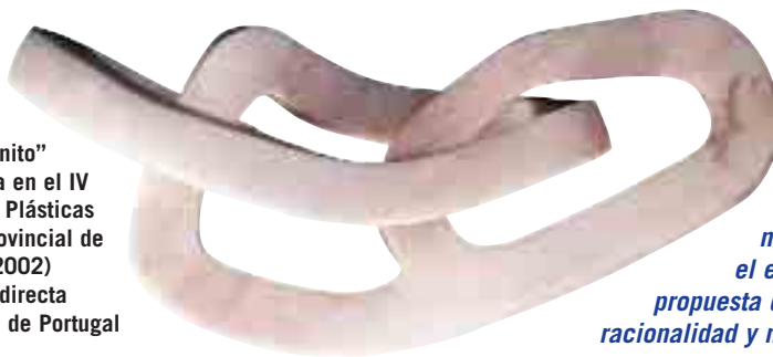
"Círculo Doble Infinito" Obra seleccionada en el IV Certamen de Artes Plásticas de la Diputación Provincial de Toledo (abril 2002) Técnica: Talla directa Materiales: Mármol de Portugal