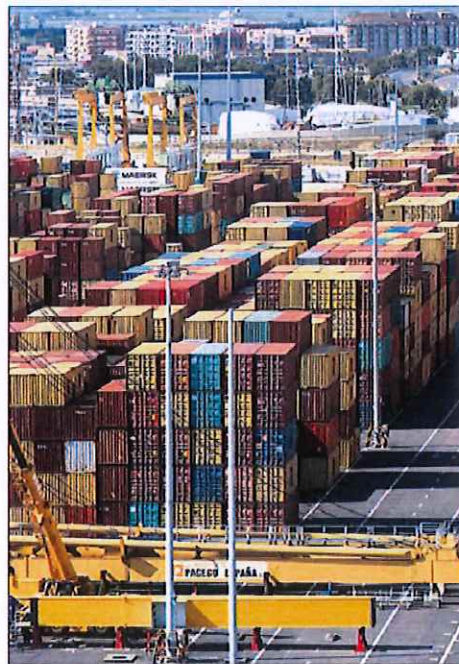
Contenedores en el puerto de Valencia.

Por eso, Boone resumió en un llamamiento urgente el mensaje principal del organismo: "Los Go-