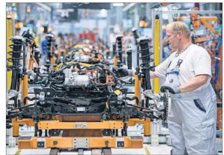
Un trabajador en una fábrica de Volkswagen, en Alemania.

El crecimiento de los servicios se vio restringido por la debilidad de la demanda, según el informe de IHS Markit. Sin embargo, las actividades manufac-