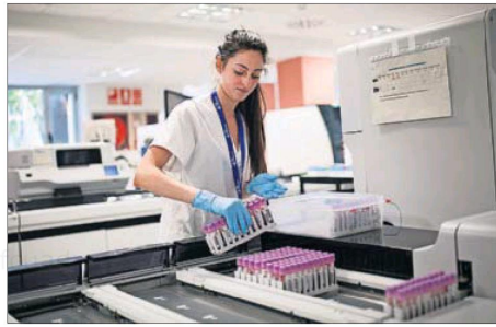
Una mujer trabaja en un laboratorio de Barcelona.

Será el mayor aumento desde 2000, el primer año para el que guarda registros el Observatorio Español de la I+D. El detalle es que la mayor parte de esta subida —1.100 millones de los 1.200 totales— se adscribe a los fondos del Plan de Recuperación, Transformación y Resiliencia de la UE para España. Esa partida va íntegramente destinada al Ministerio de Ciencia que dirige Pedro Duque.