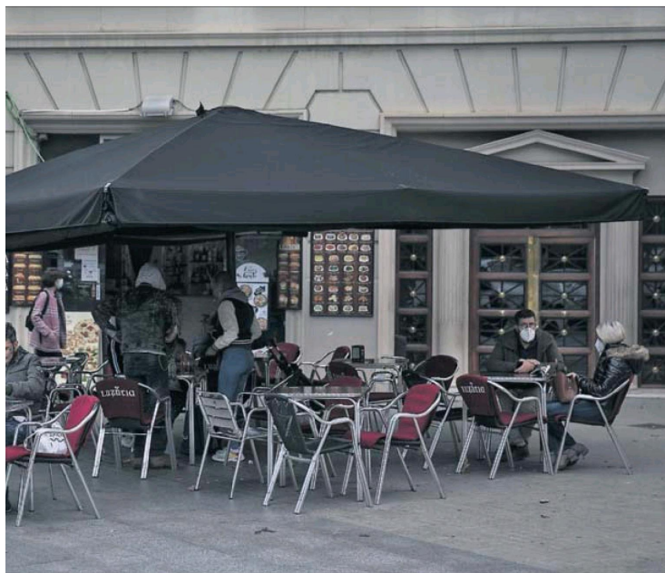
Clientes en la terraza de un bar de Esquerra de l'Eixample, en Barcelona.

Después de una crisis que en 2013 disparó la tasa de desempleo hasta el 26%, hubo seis años con descensos consecutivos, hasta alcanzar el 14%, un porcentaje que en otros países parecería una catástrofe nacional pero que en España no suena del todo a negativo. Pero el shock del coronavirus va a dejar una profunda huella. Según el FMI, la tasa de paro seguirá en niveles superiores al 14% al menos hasta donde le llega la vista al organismo con sede en Washington, es decir, hasta 2025.