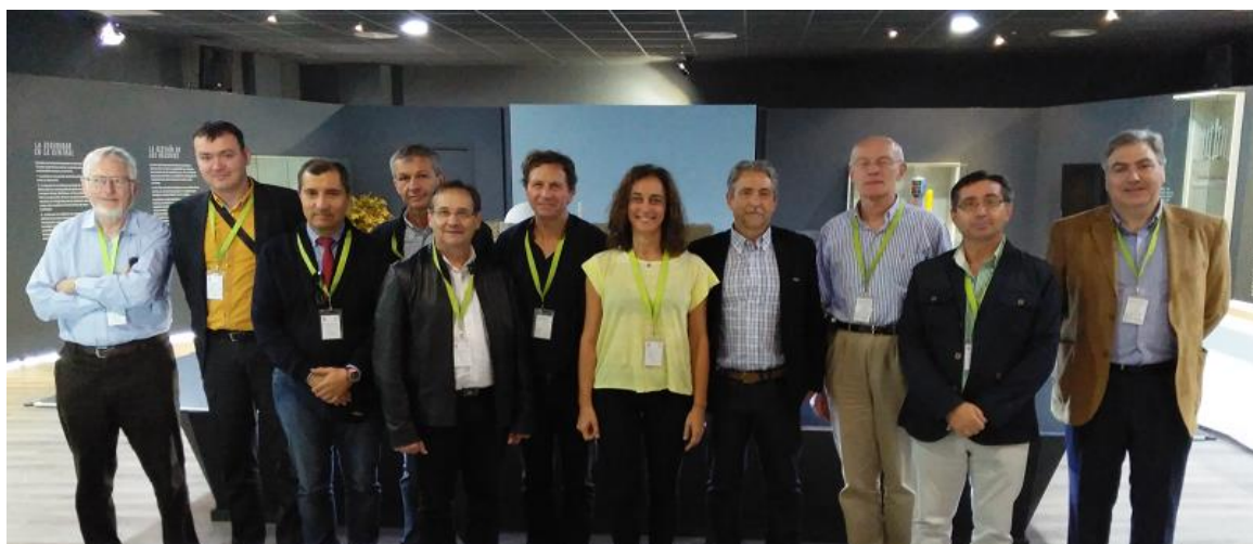
Fotografía de grupo en la que aparecen todos los miembros de FECER, FECSE y CCP que realizaron la visita a Almaraz acompañados por varios miembros del personal técnico de la planta