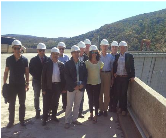
Representantes de FECER en la Central Hidráulica de Valdecañas acompañados por el presidente y la secretaria de RR.II de CCP