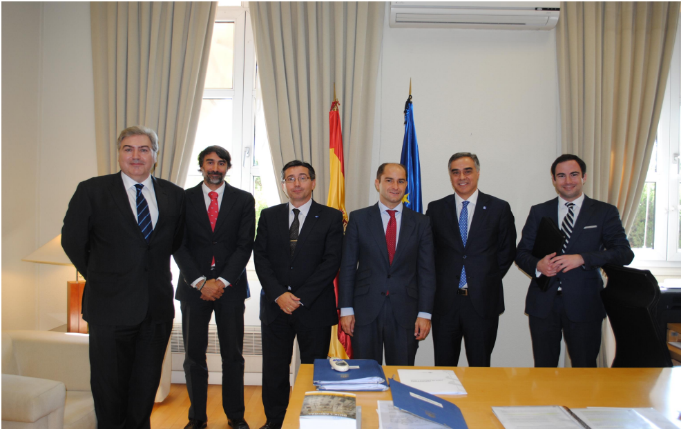
El secretario de Estado de Empleo y el director general de Empleo junto a la delegación de CCP