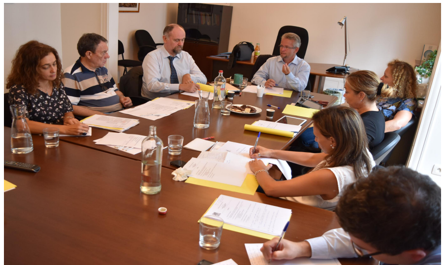
Primera Task Force de CEC en la que participaron los miembros de la Junta Directiva y representantes de diversas Organizaciones integrantes en la Confederación