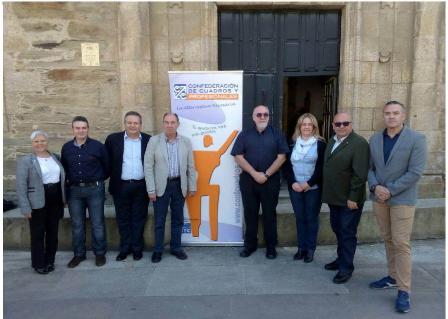
Los nuevos representantes de la Junta Directiva de la Federación de Metal