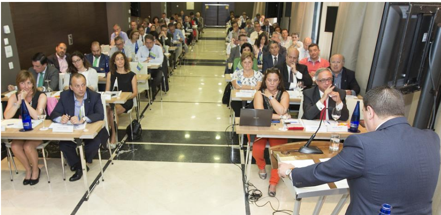
La Asamblea registró un lleno completo con la asistencia de todos los compromisarios

Por último, se convocó las elecciones para la renovación de la Junta de Gobierno de ACCAM, de la totalidad de los miembros de las distintas circunscripciones que componen la Asamblea de Compromisarios y de los Órganos de Gobierno.