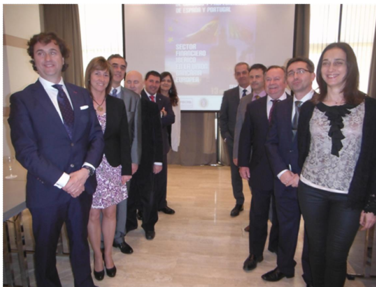
Algunos de los miembros de las delegaciones de España, Portugal, CEC y FECEC

Los Cuadros y Profesionales de España y Portugal se reunieron en Sevilla, el 13 de marzo, en el III Encuentro Intersindical que se celebra entre ambas organizaciones y que, en esta ocasión, el protagonista fue el sector financiero ibérico en la Unión Bancaria Europea (UBE).