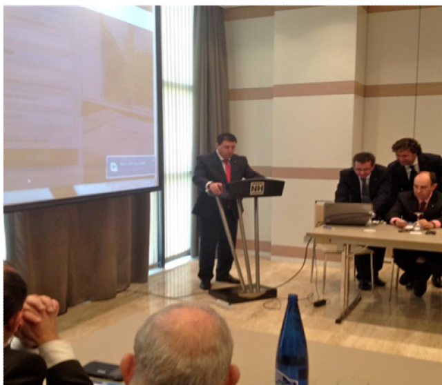
El presidente de FECFA, Ángel Bartolomé, inauguró el acto en Sevilla