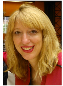
Secretaria de Igualdad y Conciliación de CCP

la vida laboral y familiar estará condenada al fracaso. La igualdad de género no se consigue con eslóganes ni con leyes simbólicas. O estamos juntos, hombres y mujeres, en esta lucha, o estamos vencidos, porque el destino de nuestra sociedad y el futuro de nuestras familias, se juega en esta batalla por la igualdad.