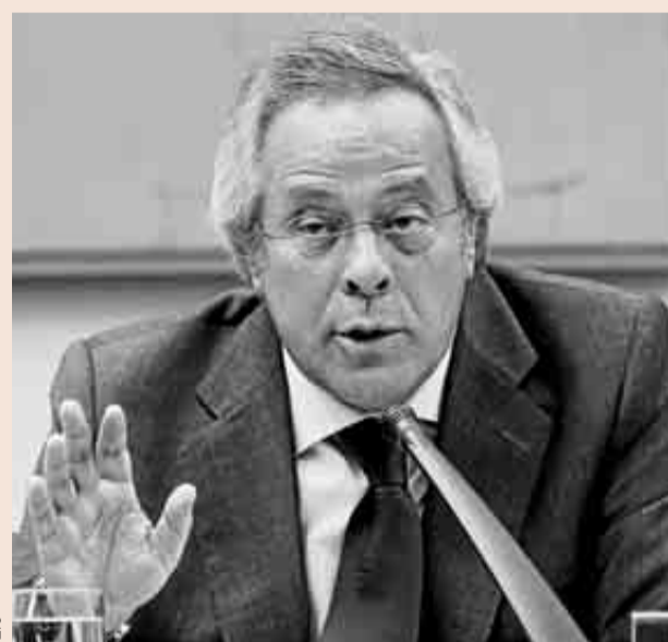
Ramón Aguirre, presidente de la Sepi.

3,62 euros, y está en máximos históricos. La lista se completa con las participaciones en empresas cotizadas que han llegado a manos del Estado, tras la entrada del Fondo de Reestructuración Ordenada Bancaria (Frob) en BFA (matriz de Bankia), Novagalicia Banco y Catalunya Banc. Hasta 3.314 millones podría ingresar el Estado por sus porcentajes en el