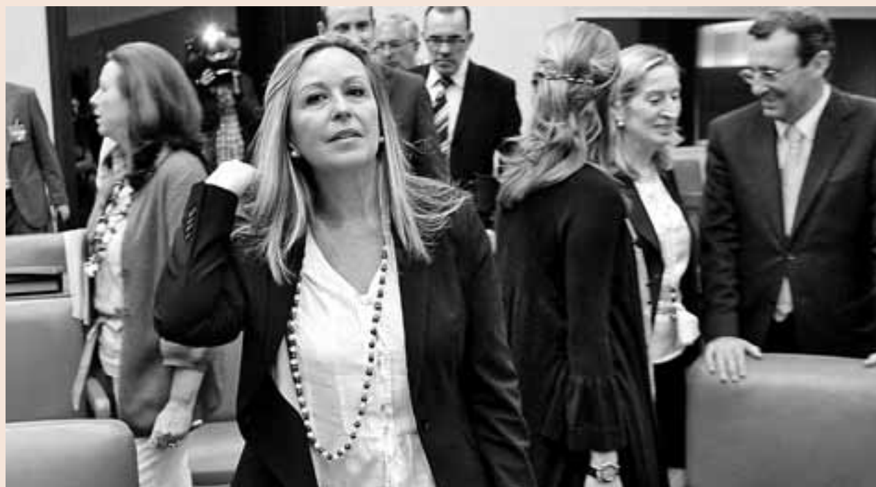
La ministra de Sanidad, Trinidad Jiménez, en una reunión con los consejeros autonómicos del ramo.

Barcelona, Madrid y Valencia han comunicado en los últimos meses al Gobierno que su opción preferida consiste en reformar los fundamentos del sistema sanitario para que no sólo se establezca el copago de los medicamentos. En-