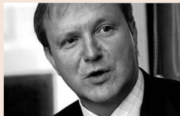
Olli Rehn, comisario europeo de Asuntos Económicos.

Siga la información en www.expansion.com