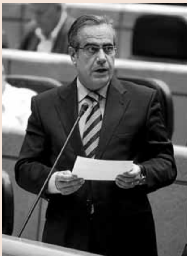
El ministro de Trabajo e Inmigración, Celestino Corbacho.

Lo que sí recogen estas enmiendas y que puede chirriar en los oídos de los sindicatos es la posibilidad de que una em-