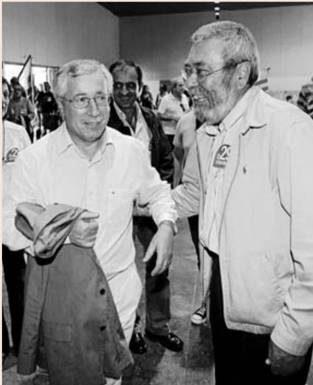
El líder de CCOO (Toxo) y el de UGT (Méndez).

Mientras esto pasa en el mundo de los empleados reales , los denominados liberados disfrutan de unas condiciones especiales. Cabe recordar que el ET reconoce a los representantes de los trabajadores “disponer de un crédito de horas mensuales retribuidas a cada uno de los miembros del comité o delegado de perso-