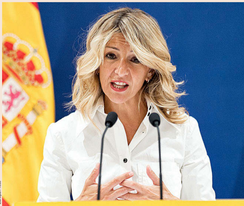
Yolanda Díaz, vicepresidenta segunda y ministra de Trabajo.

tiene un panorama más complicado para poder aprobar los presupuestos del año que viene y, por lo tanto, para poder llevar a cabo este permiso retribuido. Hasta el punto de que, según las fuentes de la Presidencia del Gobierno consultadas por EXPANSIÓN, el Ejecutivo empieza a barruntar una nueva prórroga, pero para 2025, de los presupuestos de 2023, que son los