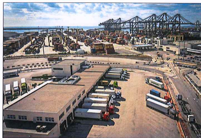
Contenedores y zona de carga de camiones en el puerto de Valencia.

Las cifras de exportaciones españolas se antojan inequívocas. Las ventas de bienes y servicios al exterior aumentan una tercera parte de lo que lo hacían el año pasado y la mitad de lo que engorda el PIB nominal. Esto significa que, por primera vez desde el inicio de la crisis, las exportaciones