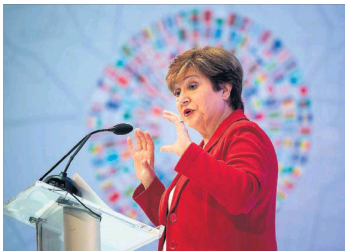
Kristalina Georgieva, directora gerente del FMI, ayer en Washington.

El discurso de la mujer llamada a pilotar el Fondo durante los