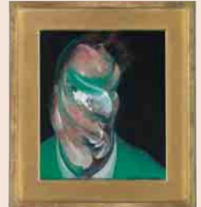
'Estudio para la cabeza de Lucian Freud' saldrá a subasta en Christie's Londres.