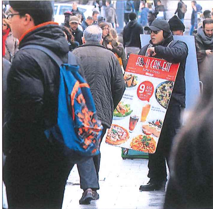
Un trabajador porta el anuncio de un restaurante en el centro de Madrid.

La brecha también aparece cuando se trata de las mismas responsabilidades o las mismas ocupaciones. La remuneración por hora de directivos y gerentes es un 12,2% menor para las mujeres. Y sigue presente tanto en temporales (7,8%) e indefinidos (13,8%), como en empleados a jornada completa (14%) o a tiempo parcial (7,4%).