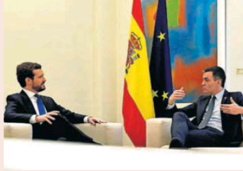
El presidente del Gobierno, Pedro Sánchez, con el líder del PP, Pablo Casado, ayer, en La Moncloa.

Pablo Casado, por su parte, le ha ofrecido a Sánchez un “compromiso por España” y el apoyo en puntos clave, que solo verían la luz en el supuesto