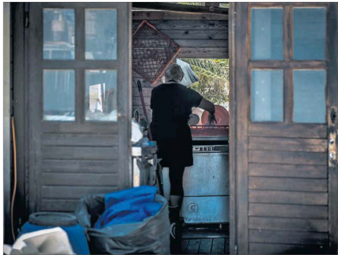
Una empleada prepara el lavavajillas en la cocina de un chiringuito de Playa de Aro.

"Partiendo de la positiva experiencia [de 2018], se van a seguir los mismos objetivos y metodología", apunta el borrador. Así, lo primero que hará la Inspección de Trabajo será bucear en los datos de la Tesorería de la Seguridad Social y de la Agencia Tribu-