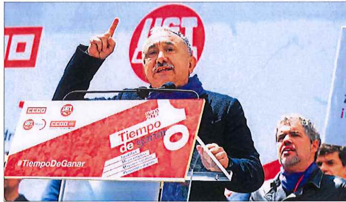
El líder de UGT, Pepe Álvarez, y detrás, el de CCOO, Unai Sordo, el pasado 1º de Mayo.

El motivo principal de la convocatoria de hoy son los salarios en el sector privado. En el público