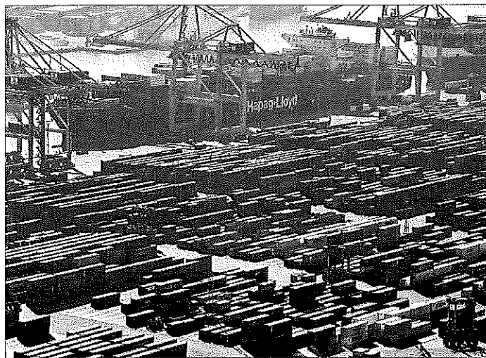
Contenedores de mercancías en el puerto de Barcelona junto a dos buques de carga.

Según el Banco, el empleo seguirá creciendo a tasas elevadas, aunque a unos ritmos algo más moderados que los observados en el último trienio. El paro irá descendiendo hasta situarse cerca del 11% a finales de 2020. El director del servicio de estudios, Pablo Hernández de Cos, argumentó ayer que los salarios tendrán que evolucionar atendiendo a las situaciones particulares de las empresas. "Aún hay un 25% con una