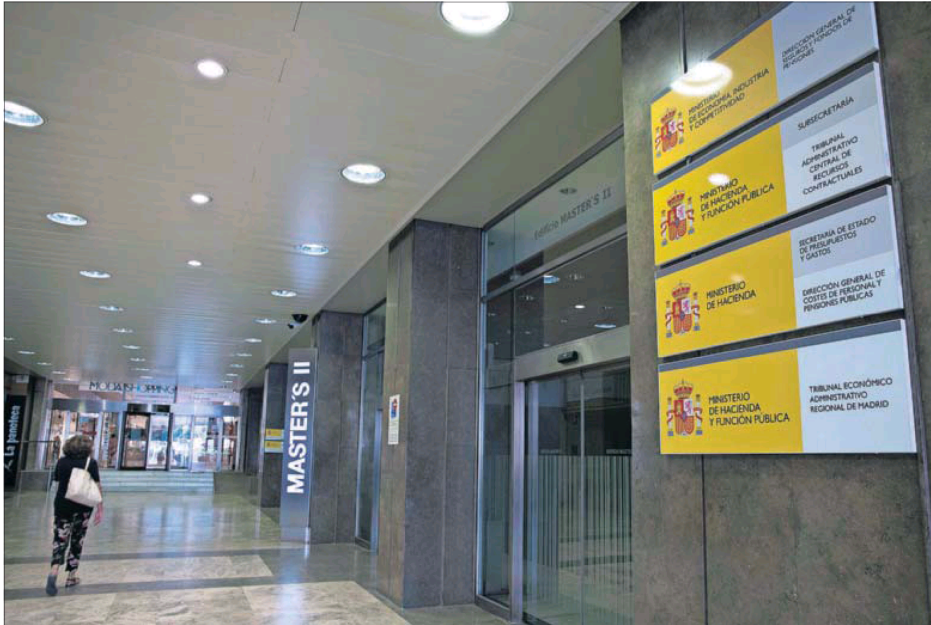
Entrada de la sede de la Oficina Independiente de Regulación y Supervisión de la Contratación, en Madrid.

La Seguridad Social cerró el mes de mayo con un endeudamiento de 46.821 millones de euros, un 71% más que la existente al finalizar 2017 y un 13,6% por encima de la que se registraba al arrancar 2018.