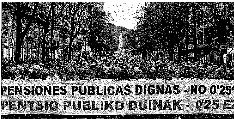
Manifestación de jubilados en Bilbao el pasado 15 de diciembre.

» CAE EL NÚMERO DE AGENTES En 2016 había 1,6 millones de agentes de policía en los países miembros de la UE. Esta cifra supone una reducción del 3,4% de las plantillas en comparación con el año 2009, según datos de Eurostat.