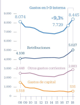
BELEN TRINCADO / CINCO DÍAS

Evolución de la inversión empresarial en I+D y sus componentes en España En millones de euros