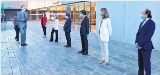
Los Reyes, ayer, a su llegada al edificio central de Distrito Telefónica, en Madrid.

ha superado los niveles previos a la última crisis, ya que los índices de crecimiento se mantienen por debajo del PIB y, por tanto, suponen una pérdida de peso relativo. En 2018, el crecimiento de la inversión, unido a la desaceleración del PIB nominal - que bajó del 4,3% al 3,5% -, ha aumentado ligeramente el peso de la I+D hasta situarse en el 1,24% del PIB. No obstante, a pesar de la tímida evolución de los últimos años, España está muy lejos del nivel máximo de inversión respecto al PIB, que alcanzó el 1,4% en 2010. Las cifras también distan mucho del objetivo del 2% que el Plan Estatal de Investigación Científica, Técnica y de Innovación fijó para