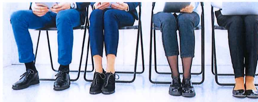
Candidatos que son citados para una entrevista de trabajo, según género, número de hijos y cualificación para el puesto

El informe también analiza las diferencias en función de la preparación de las personas y si tienen o no descendencia. En este último caso, la brecha se reduce, aunque la probabilidad de ser citada para una entrevista es un 23,5% menor para las mujeres sin hijos que para sus compañeros en las mismas circunstancias. No obstante, las madres son las que más sufren la discriminación en los procesos de selección, pues tienen un 35,9% menos de probabilidades de recibir una llamada para la entrevista que los hombres que son padres. Un efecto que se produce por la presunción de que, al tener hijos, las mujeres estarán menos comprometidas con el trabajo remunerado fuera de casa, más orientadas a la familia y más cansadas en la empresa porque dedican más tiempo a las tareas domésticas y de cuidados. En el lado contrario, el informe recoge que los hombres con hijos experimentan el denominado bonus de la paternidad por el que los hijos son considerados una