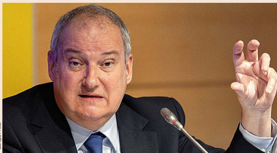
El ministro de Industria y Turismo, Jordi Hereu, ayer.

Otros datos que abonan ese giro hacia la diversificación y la calidad (sin merma de la