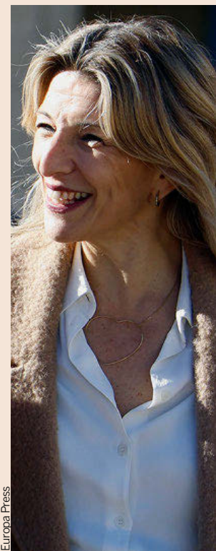
La vicepresidenta segunda, Yolanda Díaz.

Según la CEOE, la productividad por ocupado en España ha disminuido de forma significativa desde el año 2019, en contraste con el crecimiento que ha experimentado en el conjunto de la Unión Europea. Todo ello en un contexto en el que la economía española sigue claramente rezagada, con unos niveles de productividad más bajos que los de sus homólogos comunitarios. Así lo refleja un estudio del Ivie y la Fundación BBVA, que muestra que la productividad de la economía nacional se encuentra estancada en niveles de hace una década (ver información principal).