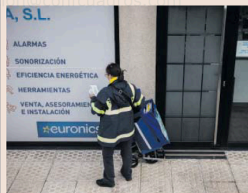
Una cartera en A Coruña, el pasado enero.

Sin embargo, la variación interanual recogió que las mayores reducciones se registraron en actividades de agencias de viajes, operados turísticos y actividades relacionadas, donde el porcentaje de horas perdidas retrocedió 1,3 puntos en un año. En las actividades inmobiliarias, el decrecimiento interanual fue de 0,3 puntos porcentuales.