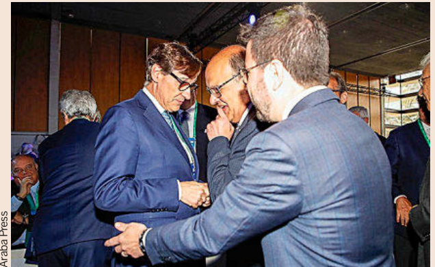
Salvador Illa (PSC), Xavier Panés (Cecot) y Pere Aragonès (ERC), ayer.

En la inauguración de la jornada, también intervino el presidente en funciones, Pere Aragonès, quien sacó pecho de gestión por haber logrado "sanear las cuentas públicas". Así, en 2021, cuando llegó al cargo, el peso de la deuda sobre el PIB era del 37%. Una vez se materialice el acuerdo de investidura entre ERC y el PSOE, que incluía la asunción de una parte del pasivo que está en manos del Estado, el